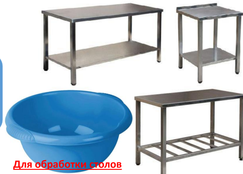
Для обработки столов

Для моющих и дезинфицирующих средств, применяемых для обработки столов, выделяют специальную промаркированную емкость